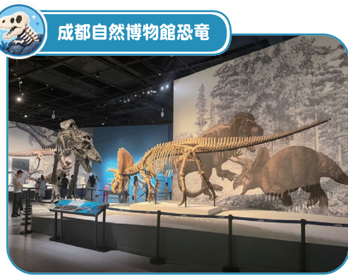
成都自然博物館恐竜