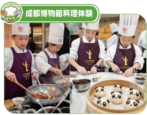
成都博物館料理体験