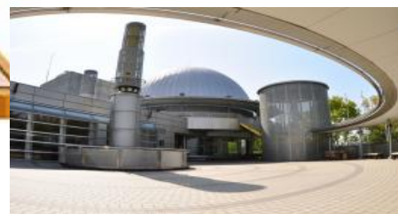
小川げんきプラザ