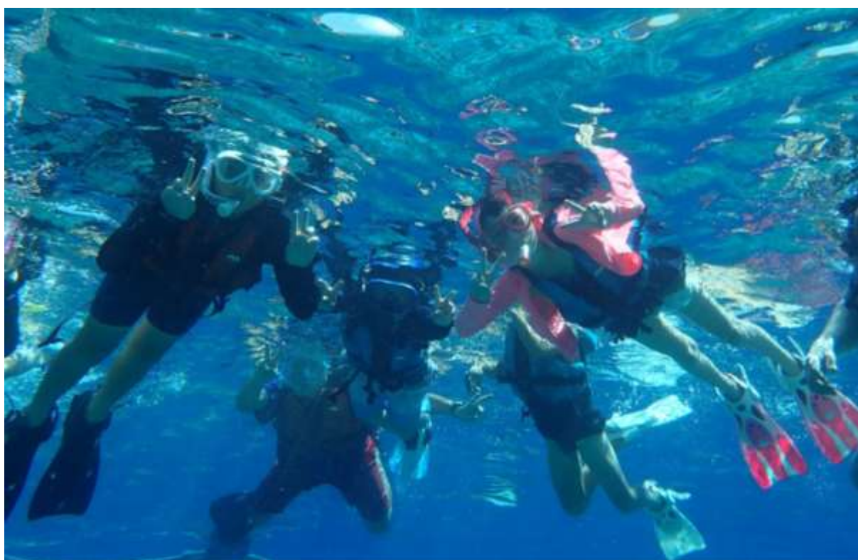
シュノーケリング